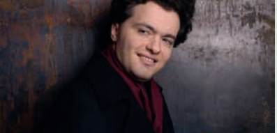
Puccini: Preludio sinfonico; Bartók: Klavierkonzert Nr. 2; Respighi: Fontane e Pini di Roma CHF 220 / 160 / 135 / 95 / 65

Sa 26.8 19.30 Uhr, Festival-Zelt Gstaad GALA Sinfoniekonzert Roma a Gstaad II – Fontane di Roma Evgeny Kissin, Klavier; Orchestra dell'Accademia della Santa Cecilia Roma; Sir Antonio Pappano, Leitung