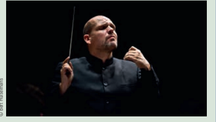
Ravel: Pavane pour une infante défunte; Lalo: Cellokonzert; Tschairowsky: Sinfonie Nr. 5 CHF 160 / 135 / 95 / 65

Sa 19.8 19.30 Uhr, Festival-Zelt Gstaad Sinfoniekonzert Welcome Jaap van Zweden! Gstaad Festival Orchestra II Sol Gabetta, Violoncello; Gstaad Festival Orchestra; Jaap van Zweden, Leitung