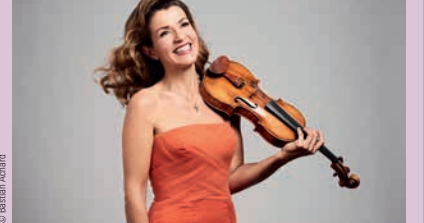
Werke von Mozart (Violinsonate Nr. 35), Saint-Saëns (Introduction und Rondo Capriccioso), Ravel (Violinsonate), Poulenc (Violinsonate) und Currier («Clockwork») CHF 220 / 160 / 135 / 95 / 65