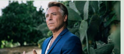
Verdi: «Aida», Oper in 4 Akten (konzertante Aufführung) CHF 220 / 160 / 135 / 95 / 65